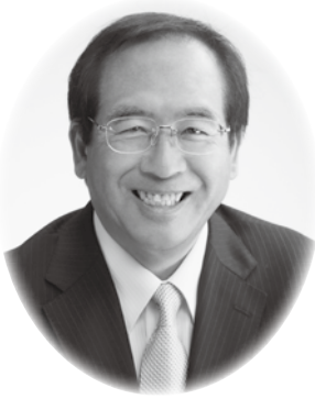
副企業長(北本市長)

できる水道」、「非常時にも強靱な水道」、「効率的な事業運営と持続できる水道」を基本目標とし、更に「SDGs」の理念に基づく持続可能で強靱な質の高い水道を目指して、副企業長共々全力で取り組んでまいりますので、なにとぞ市民の皆様のご指導とご協力を賜りますようお願い申し上げます。就任にあたっての挨拶といたします。