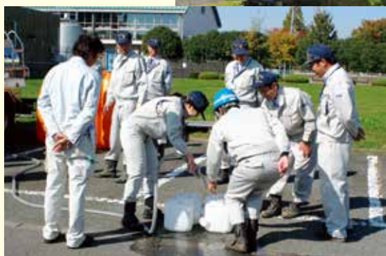
◀ 給水タンク車からポリタンクへの給水