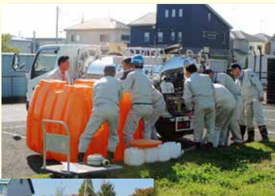
給水タンク車 ▶ から給水タンクへの注水

水道企業団では、毎年、震災時招集訓練や応急給水訓練を実施しています。平成29年度の訓練では、給水タンク車を使用し、操作方法の習得及び確認をおこないました。その他にも桶川、北本市の防災訓練に参加し、防災意識の向上や、各防災関係機関との連携強化に取り組んでいます。水道企業団はこれからも災害時に備え、訓練や資器材の備蓄など防災対策に力を入れてまいります。